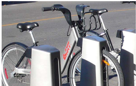
Top: purple edible interlaced cups, by Diane Bisson.